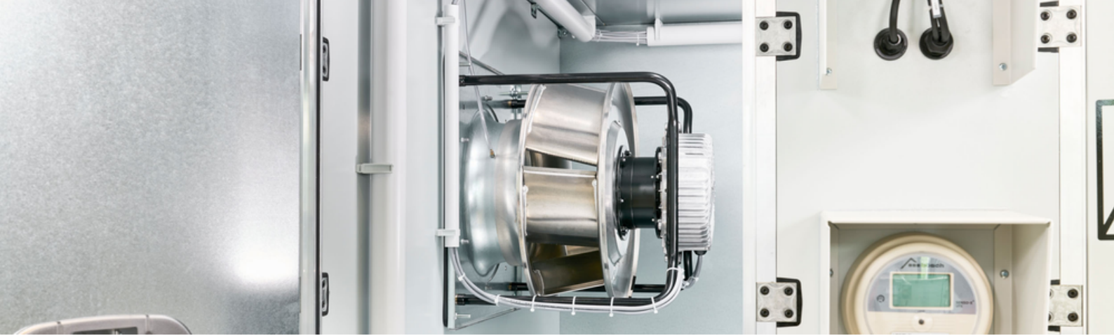
EC-Ventilatoren als Standardausführung für die Zuluft.