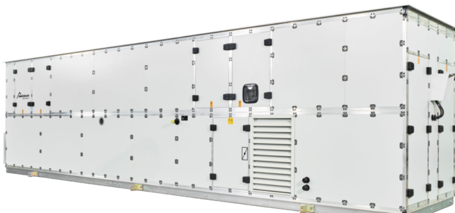
RLT-Anlage für die Großküche des Pflegeheim Edeweicht

Energieeffizienz und Wirtschaftlichkeit spielten neben einer normgerechten Ausführung der Gesamtanlage ebenso eine entscheidende Rolle. Um die Montagezeit so kurz wie möglich zu halten und unnötige Schnittstellen zu reduzieren, wurde das Lüftungsgerät als "steckerfertige" Einheit konzipiert. Es wurde in Vorarlberg gefertigt, per Sondertransport nach Edeweicht geliefert und mit einem Autokran aufs Dach an seinen neuen Bestimmungsort gehoben.